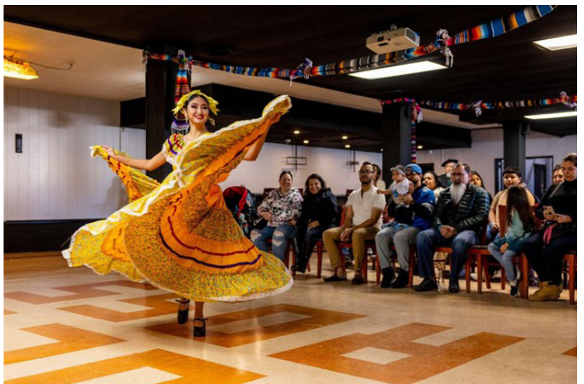
Attendees were entertained by a performance of ballet folclorico