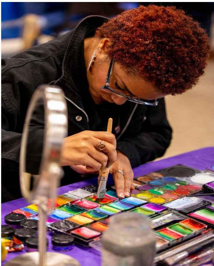
Local vendor creating art live during the event