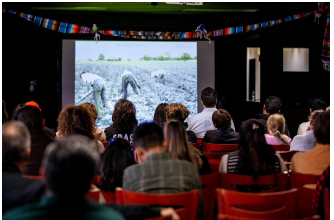
Spectators watch the documentary “Michoacan to Michigan” at Vallarta Live